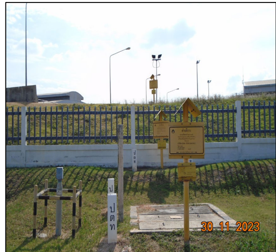
ป้ายเตือนแนวท่อส่งก๊าซธรรมชาติ