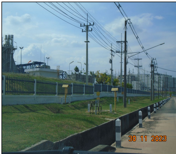
ป้ายเตือนแนวท่อส่งก๊าซธรรมชาติ